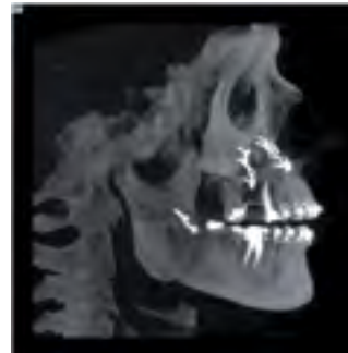
NewTom 5G XL